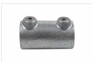
Extension tube 42