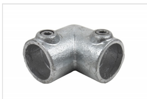
Lock tube 42