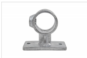
Wall mount tube 42